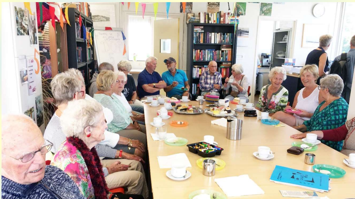
Afb. 12. DOP viert 15 juni 2018 met een grote opkomst zijn 5-jarig bestaan met gratis consumpties en gebak

Woensdag 4 april heeft een rollatorkeuring in de kerk plaatsgevonden. 12 bezoekers hebben hun rollator laten nakijken. De meeste rollators werden direct goedgekeurd, een enkele na een kleine reparatie ter plekke. Eén rollator werd afgekeurd.