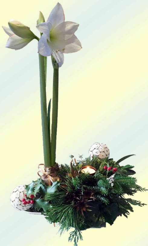
Afb.14. Als dank voor hun inzet het afgelopen jaar ontvingen alle DOP-vrijwilligers eind december van het bestuur een bloemstukje