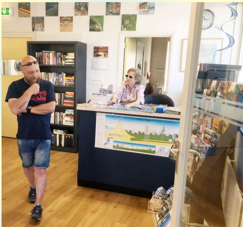
Afb. 5 Een tevreden VVV-bezoeker verlaat de DOP 23-07-2018

Ter ondersteuning van deze informatievoorziening gebruiken we indien nodig de computer. Daarbij kunnen we steeds meer informatie opvragen die op andere wijze niet beschikbaar is. Ook doet de aangeschafte telefoon zo nodig goede diensten.