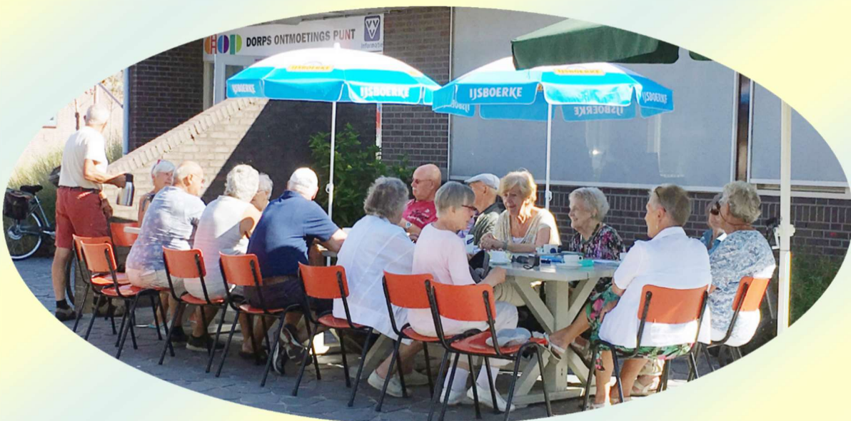
Afb. 1. In de warme zomer van 2018 was het vaak mogelijk om met veel plezier van het buitenterras gebruik te maken, zoals hier op 3 augustus 2018

Het bestuur heeft uitbreidingsvoorstellen van het DOP-gebouw in voorbereiding, zie hoofdstuk 11.