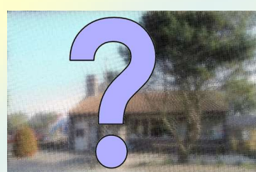
Afb. 18. Het VVV-kantoor in 2013, DOP-gebouw in 2014 en DOP-gebouw na 2020