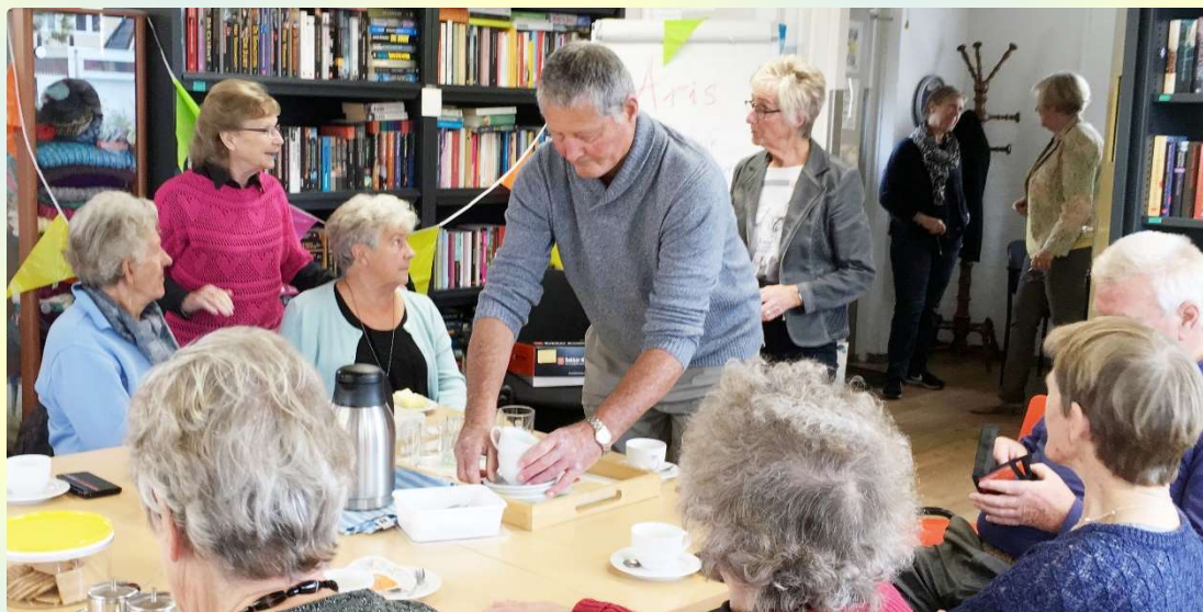
Afb. 17. Volle bak in de DOP 7 november 2018

DOP betaalt aan SEBAP huur voor gebruik van het DOP-gebouw en de kerk. Voor de financiering vraagt DOP bij de gemeente Schagen subsidie aan. De eerste jaren bedroeg dat € 2.700,-. Voor 2018 € 2.200,-. In juni hebben we een subsidieverzoek voor het jaar 2019 ingediend. Deze kon vanwege toegenomen inkomsten tot € 2.000,- worden beperkt. Eind december ontvingen we bericht dat de subsidie voor 2019 is toegekend.