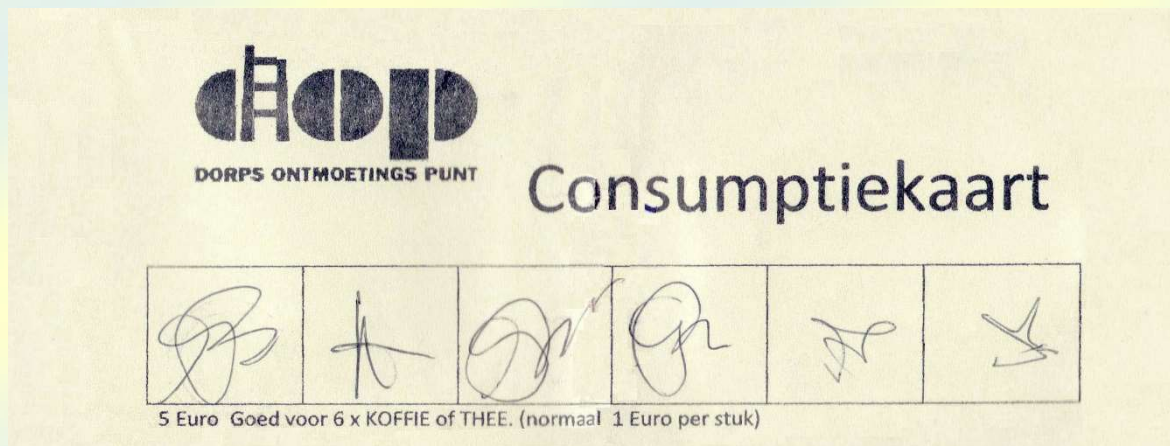
Afb. 16. Consumptiekaart DOP, goed voor zes consumpties

Die verwerkt dit periodieke in de overzichtsstaten. De toename van het aantal bezoekers beïnvloedt het kassaldo positief.