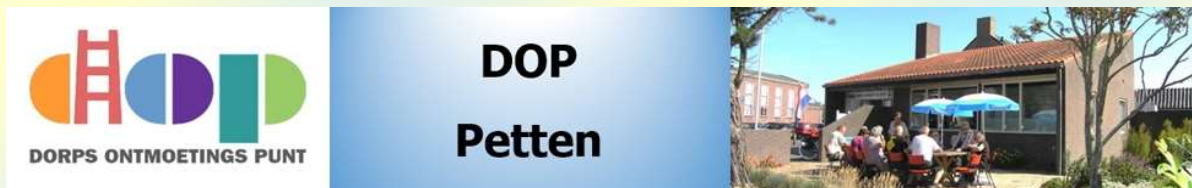
Afb. 7. Bovenbalk website www.doppetten.nl

Vanaf augustus 2015 is onze website www.doppetten.nl actief.