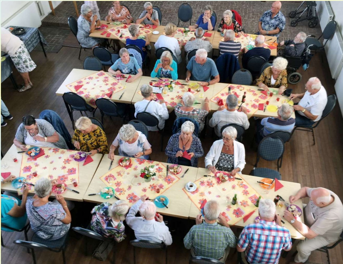
Afb. 6. Brunch in de kerk 12 augustus 2018

We hebben om deze redenen zo weinig mogelijk van de kerk gebruik gemaakt. Het Multifunctioneel gebouw bij de sporthal is een andere mogelijkheid, maar is voor een aantal van onze bezoekers te ver om daar op eigen kracht naar toe te komen.