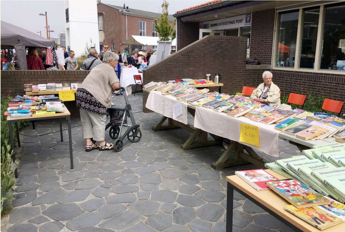
Afb. 3. De verkoop van boeken vereiste een ruime opstelling zowel binnen als buiten het DOP-gebouw

Tijdens deze boekenverkoop kregen we behalve de ondersteuning van onze vrijwilligers ook hulp van een aantal van onze vaste bezoekers. Dat was gezien de grote toeloop van bezoekers erg welkom.