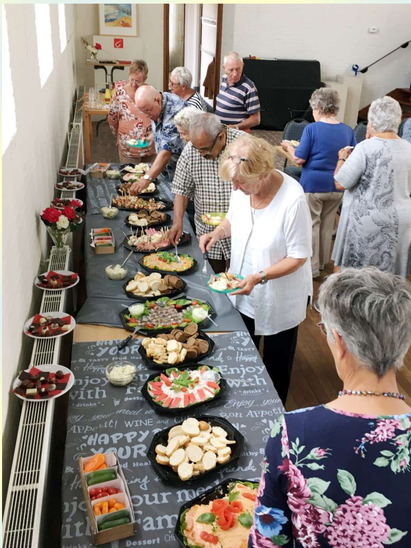
Afb.: 11. Brunch DOP in de kerk 12 augustus 2018

Door een geleidelijk aan grotere toeloop van bezoekers en de wens om onze activiteiten uit te breiden met het organiseren van gezamenlijk maaltijden is de wens ontstaan te onderzoeken of uitbreiding van het DOP-gebouw mogelijk is. Zie daarvoor hoofdstuk 11.